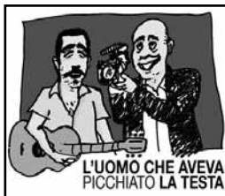
L'UOMO CHE AVEVA PICCHIATO LA TESTA

Il film di Virzi ritrae Bobo, negli anni 90 leader degli Ottavo Padiglione (come il reparto di psichiatria dell'ospedale di Livorno) insieme ai quali ha toccato il successo con il brano Ho picchiato la testa, in un momento di crisi: la moglie lo chiude fuori di casa e lui diserta gli appuntamenti professionali importanti. Storia di un successo mancato forse di proposito.